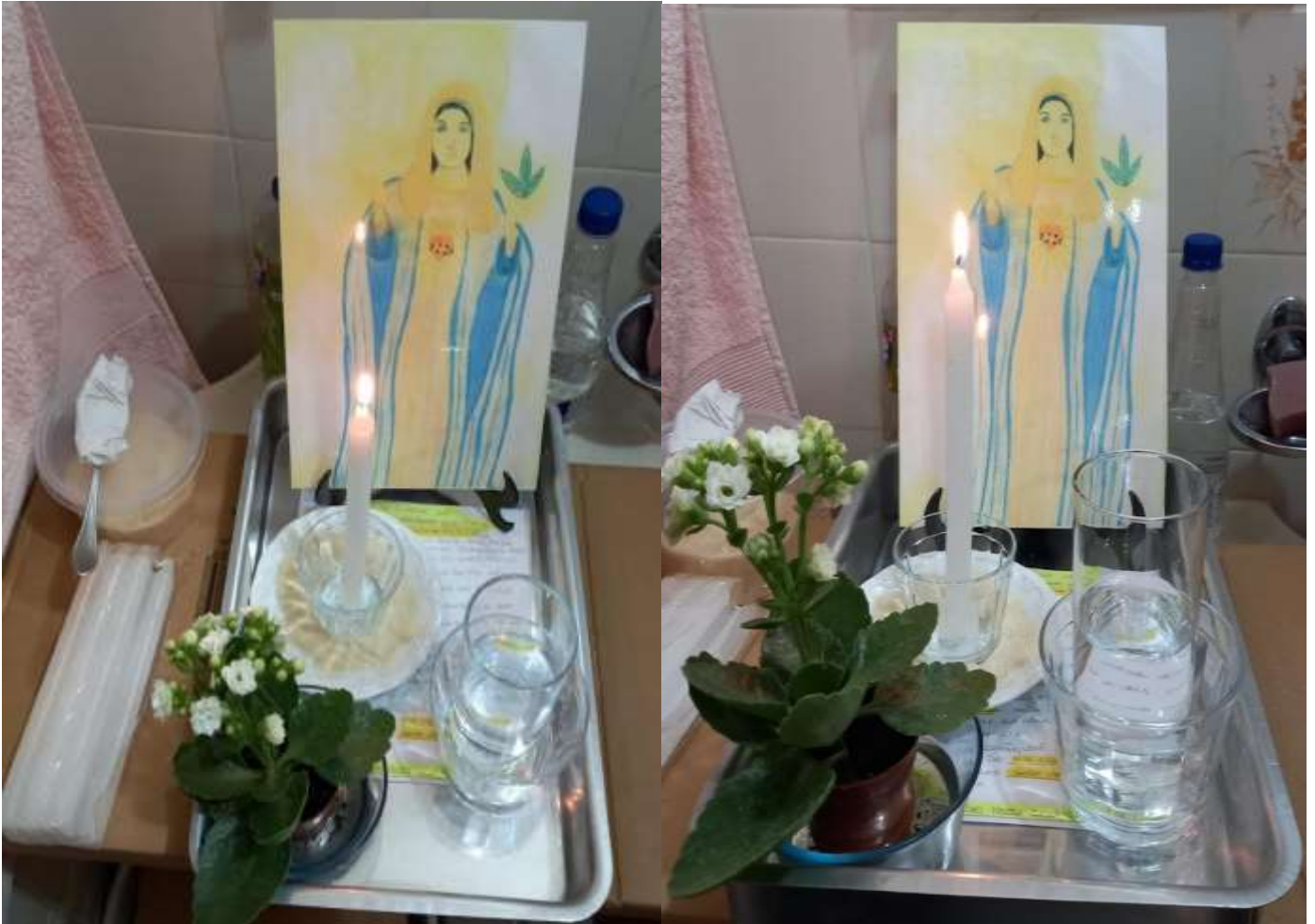
Imagem do Texto, Escrito a Mão, para se ter uma Outra Opção, a ser colocado debaixo do Pires com a Vela