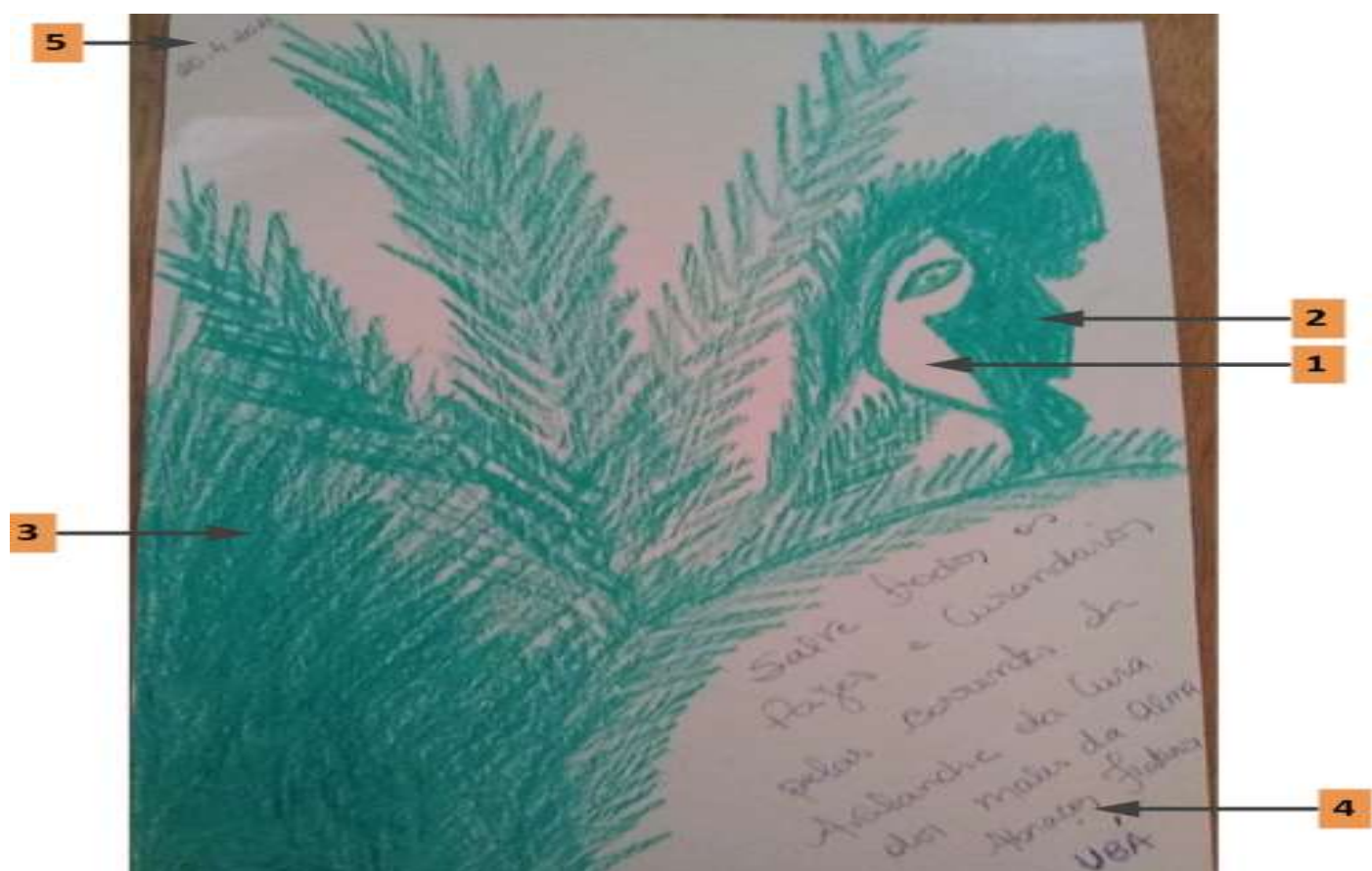
Fig.5- Legendas da Fig.4