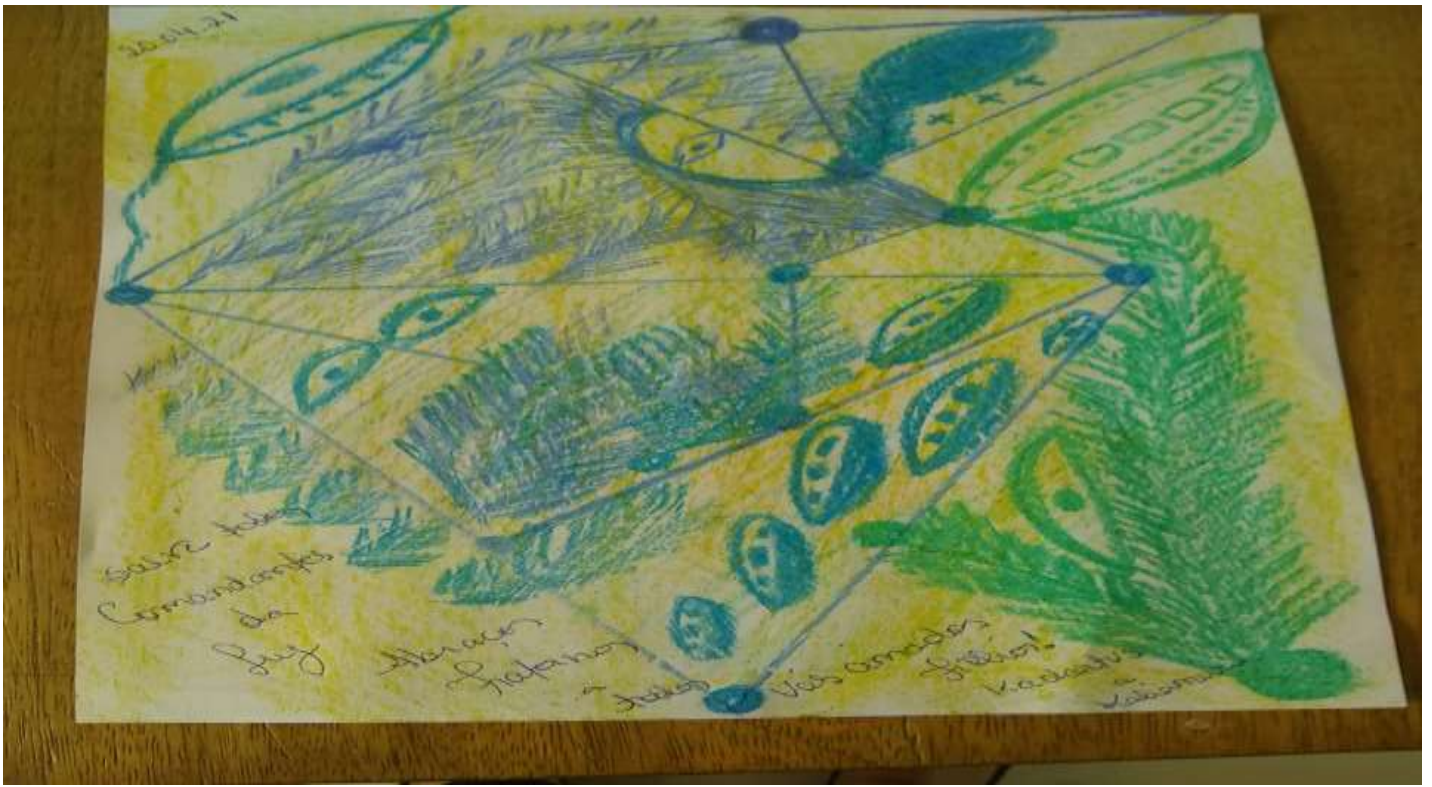
Fig.1- Desenho original do Mentor Kadartus