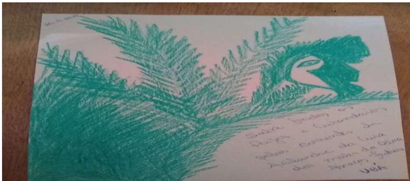
Fig.4- Desenho original do Cacique Pai Ubá- complemento para a Mensagem do Mentor Kadartus