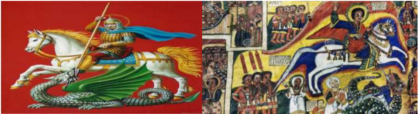
Imagens tradicionais representativas de São Jorge com o “Simbolismo do Cavalo e o Dragão”