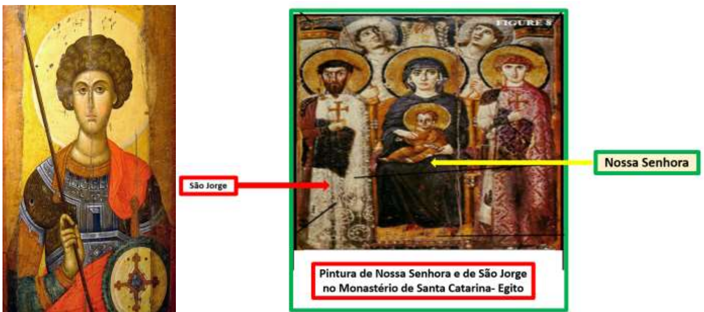
Imagens de São Jorge na Igreja Cristã Copta do Egito