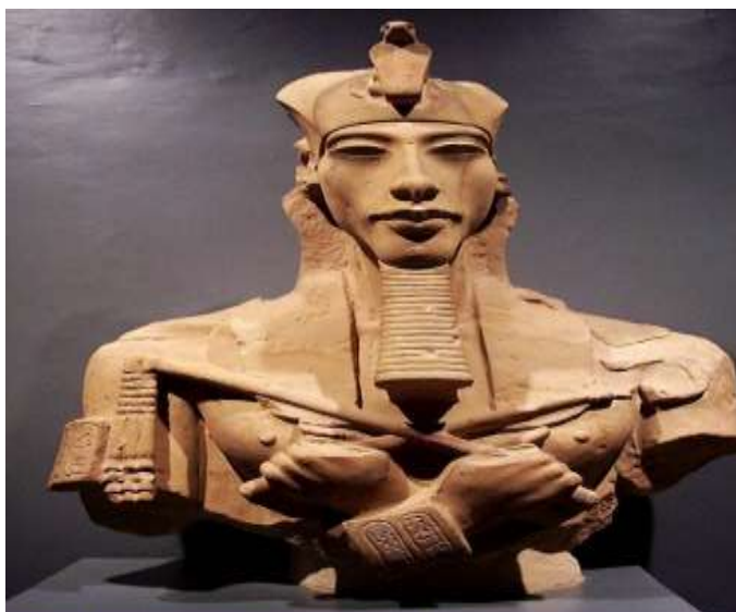
Estátua do faraó Akhenaton. Museu de Luxor, Egito.