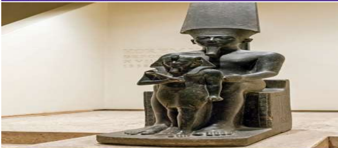
Estátua do faraó Horemheb (o menor) em frente ao deus Amon (o maior atrás). A estátua deixa claro não só o fato do faraó se posicionar como defensor do deus, mas também que o deus o protege com seus braços. Museu de Luxor, Egito.