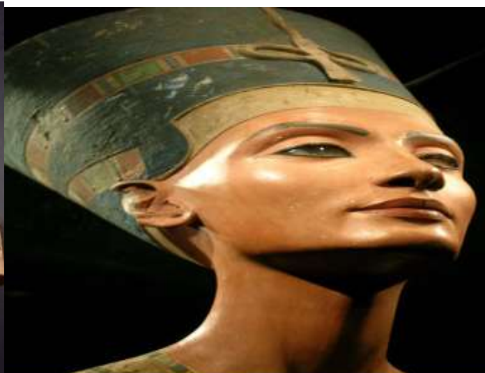
Busto da rainha Nefertiti encontrado em Amarna. Neues Museum, Berlim.