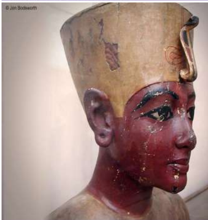
Busto de Tutâncamón. Museu do Cairo, Egito.