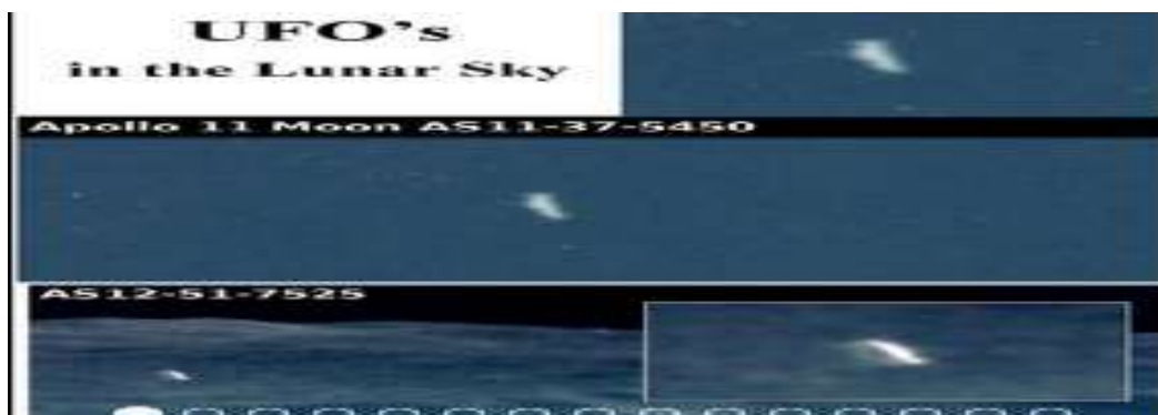
( d ) – UFOs na Lua