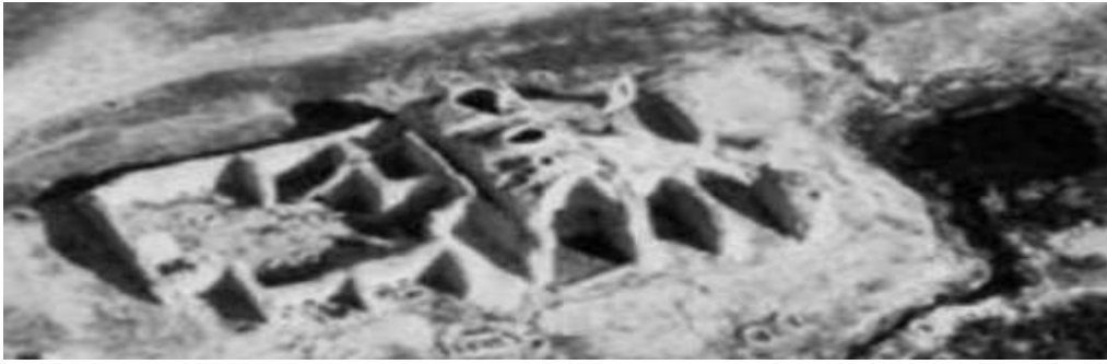
( a )- Lua- Estrutura