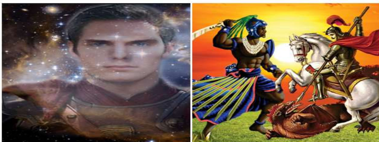
Mestre Ascenso Lonnán - São Jorge

Virtudes → Proteção, Ascensão, Liberdade, Transformação, Justiça, Misericórdia, Compaixão