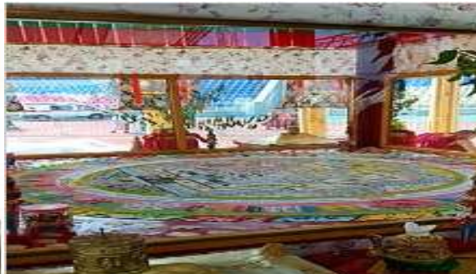
Exemplos de Mandalas