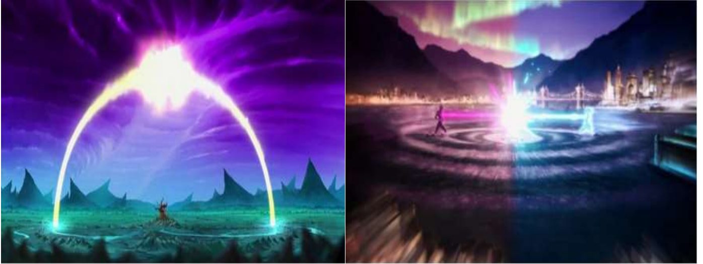
Exemplos de Portais

Os Portais Energéticos são um ponto de convergência onde as energias do universo estão mais acessíveis e fluem com maior intensidade. Assim, acredita-se que esses portais facilitam os processos de cura, conexão espiritual, transformação pessoal, e manifestação de intenções.