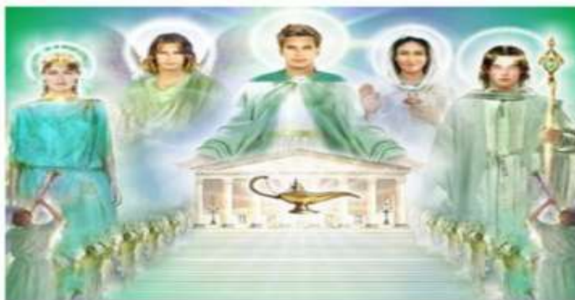
Fig.1- O Comando Santa Esmeralda

O Amado Mestre Hilarion representa um importante fator de disseminação dessa egrégora para todo o planeta e possui milhões de discípulos na Terra e nas outras realidades dimensionais. Como o aspecto de cura é muito importante em diferentes escalas e realidades, desde um Umbral até uma realidade física ou supra física, ainda mais com a importante tarefa de reconstituir o DNA sagrado de 12 filamentos ou mais, e por causa disto acaba ocorrendo um intercâmbio com o Conselho Cármico e com o grupo do Comando Melchizedeck. Assim cada Comando possui importantes atributos, mas estão todos interligados pela própria lei universal da necessidade e da sincronidade.