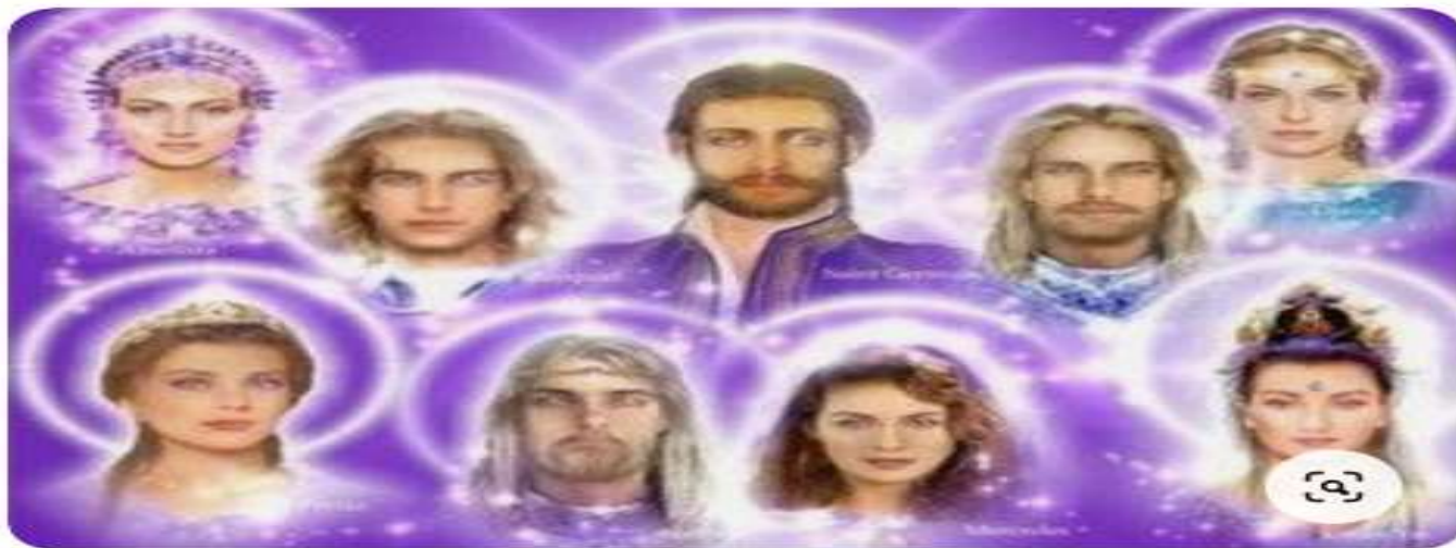
Fig.2- O Comando Santa Ametista

O trabalho de remoção da barreira de frequência de exílio e quarentena da Terra, está a cargo desse último grupo, assim como as trocas de informações e de mútua ajuda em relação ao Comando Santa Esmeralda, que de maneira geral, também é de transmutação, pois a Cura é uma forma de transmutação.