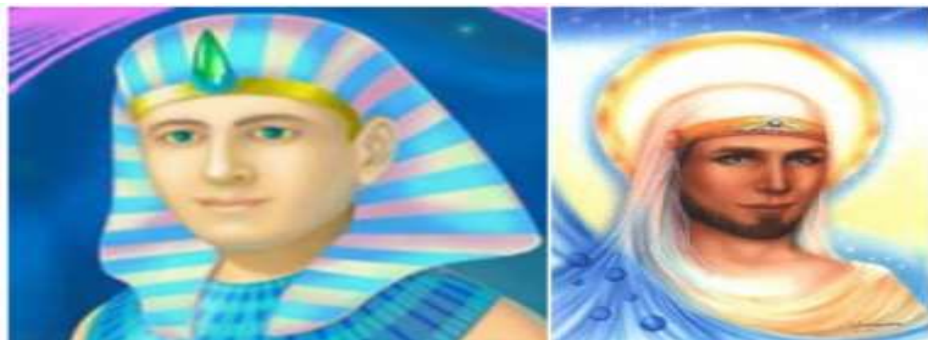
Mestre Serapis Bey