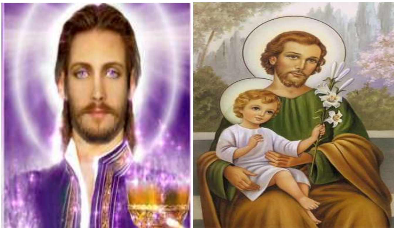
Mestra Saint Germain – São José