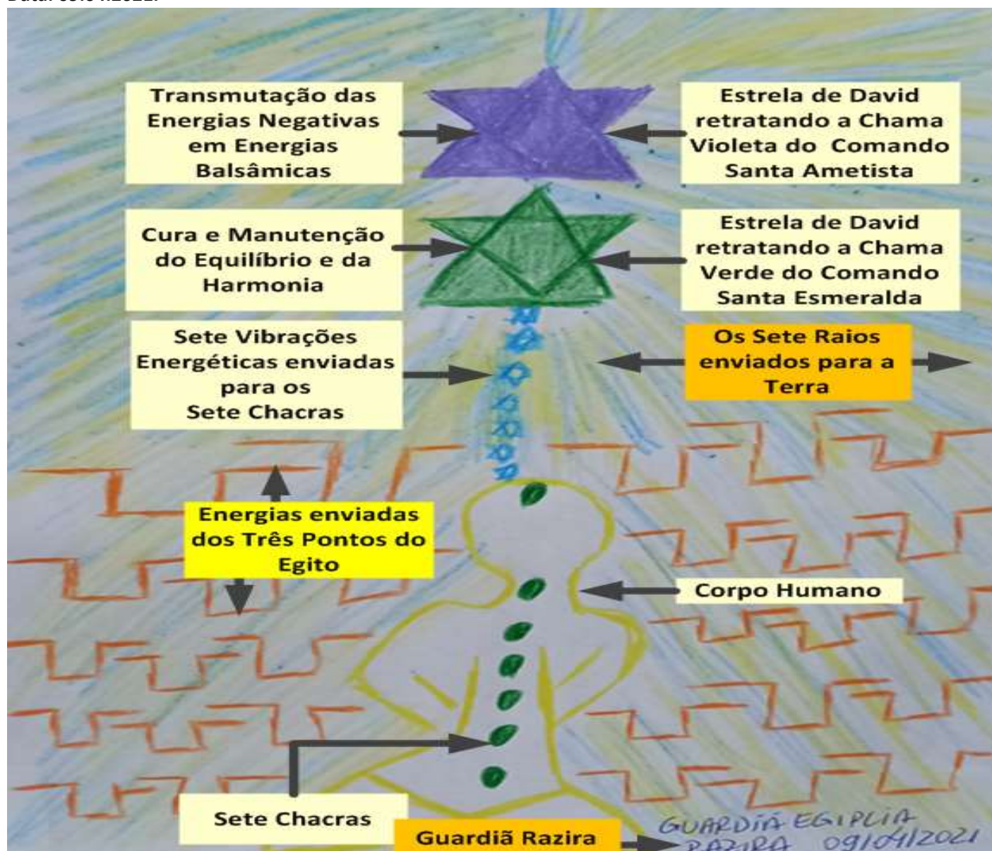
Figura retratando as atuações dos diferentes tipos de Energias no Ser Humano e na Terra.