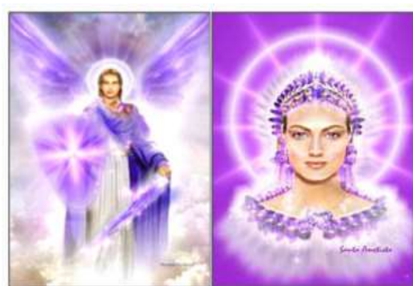
Gabriel e Ametista