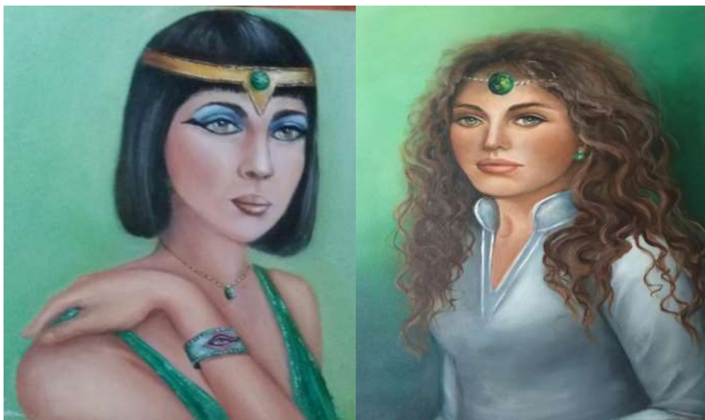
Pintura Mediúnica da Mestra Razira e da Mestra Kaliimirra

Esta Corrente de Cura trabalha na Linha de Assentamento e Consagração de Nossa Senhora dos Remédios. Santa Isabel, mãe de São João Batista, atua com mensagens para este Grupo de Estudos através desta Linha de Curas. O número de Dirigentes do Conselho da “Corrente da Avalanche da Cura dos Males da Alma” é igual a 72, e é constituído por Espíritos de elevado escol que viveram há mais de 8500 AC no Antigo Egito, como o Mestre Zanartiel, que é líder espiritual desta Corrente.