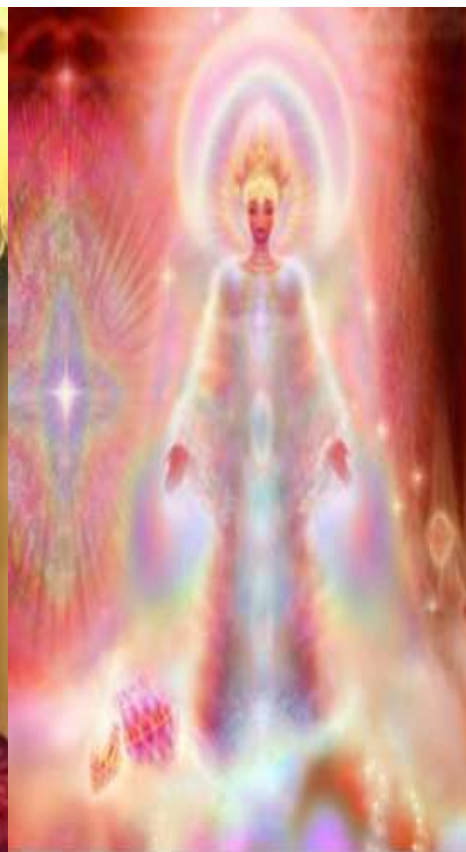
Mestra Nada – Maria Madalena