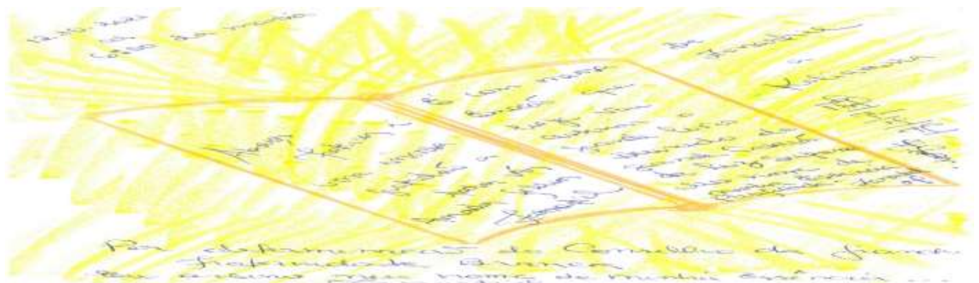
O “Grande Livro Dourado” no “Grande Casarão de Luz Suprema- Assinatura do Mestre Zanartiel

É com imenso carinho que tenho por todos Vós, que hoje nesta data de 12.10.2021, do vosso Planeta Terra, que eu estou nesta Dimensão Sideral com o coração transbordante de alegria e amor devido a uma consagração de Espírito para Espírito, onde eu e mais os meus Queridos e Amados Irmãos e irmãs, desta Corrente, estamos sendo merecedores de mais um Grau de Evolução, no qual vamos assinar o “Grande Livro Dourado” no “Grande Casarão de Luz Suprema”.