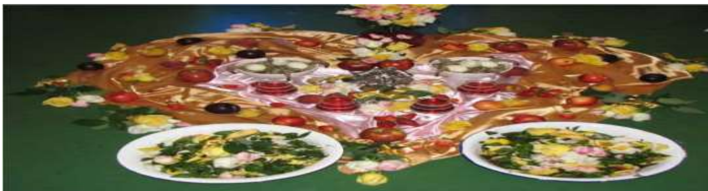
Fig.16- Oferendas para Oxum

Velas rosa, amarela e azul claro, flores diversas, morango, cereja, maçã, champanhe rose. Pode oferendá-la numa cachoeira.