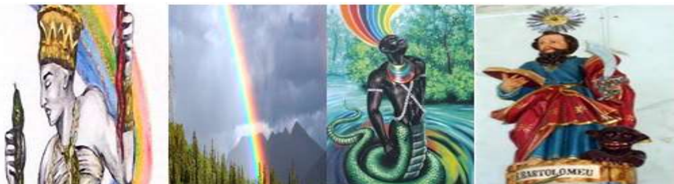
Fig.17- Representações para Oxumaré

Oxumaré é sincretizado com São Bartolomeu e por isso em algumas regiões do país no 24 de Agosto, comemora-se o dia deste Orixá. É possível observar que algumas imagens o Orixá aparece sendo metade serpente e metade homem.