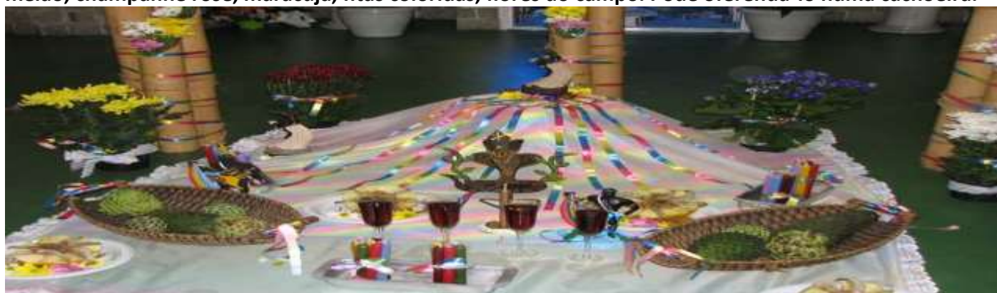
Fig.18- Oferendas para Oxumaré

Velas branca, azul claro, verde, dourada, vermelha, roxa, marrom, amarela (amarradas todas juntas), melão, champanhe rose, maracujá, fitas coloridas, flores do campo. Pode oferendá-lo numa cachoeira.